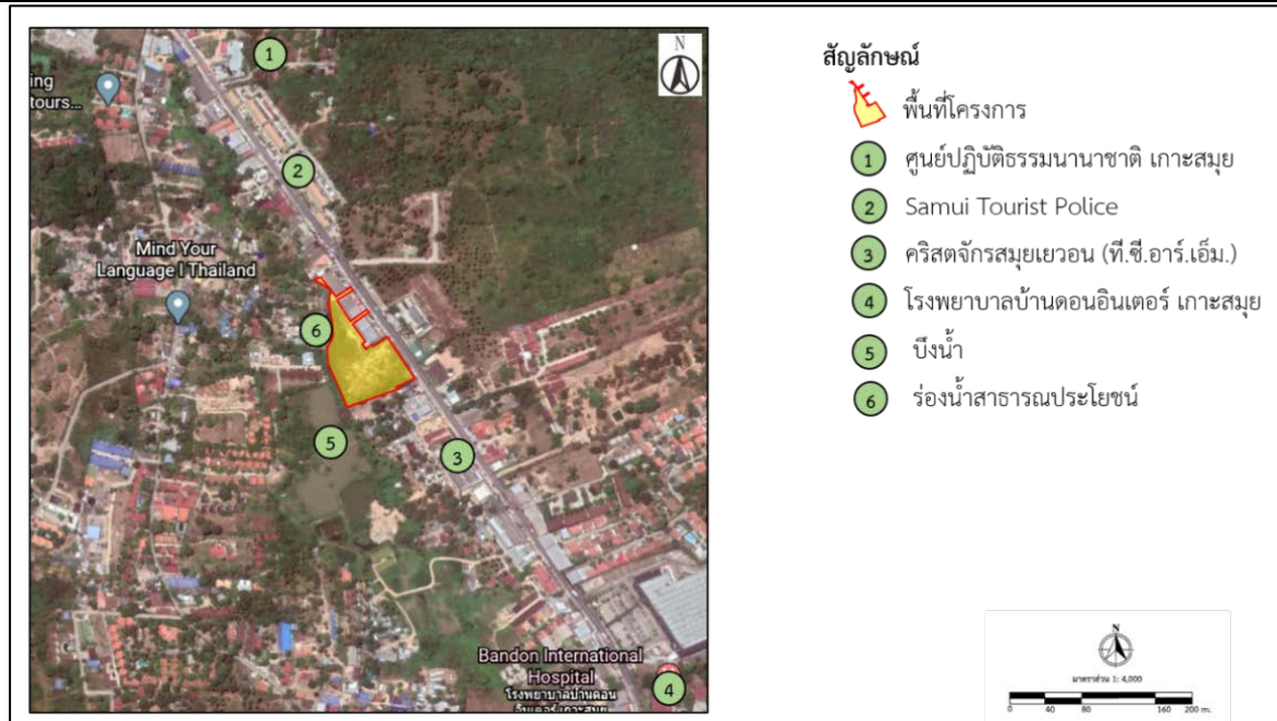
รูปที่ 1.2-1 แผนที่ตั้งโครงการ